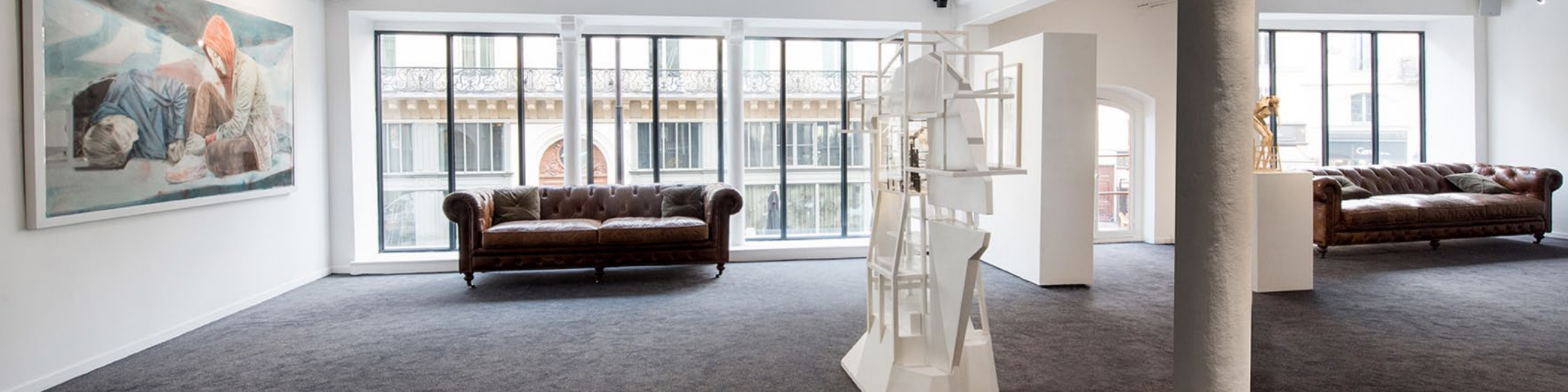
Œuvres d'Iris Levasseur et de Clément Bagot, collection privée. Exposition 5X2, Artcollector 2016.